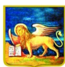
REGIONE DEL VENETO