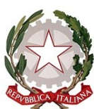
REGIONE DEL VENETO